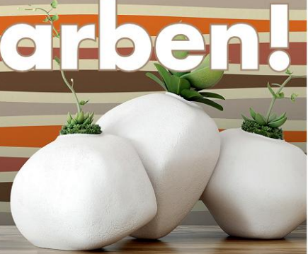
Swing Tapete mit Querstreifen www.gmm-berlin.com

Die siebziger Jahre waren kulturell geprägt vom Discofieber, das aus den USA nach Deutschland schwappte und extrem schrille modische Kreise nach sich zog. Den politischen und wirtschaftlichen Veränderungen jenes Jahrzehnts trotzte man mit leuchtenden Farben, extravaganten Mustern sowie einem neuen Lifestyle. Ein bisschen davon ist zurück. Yeah!