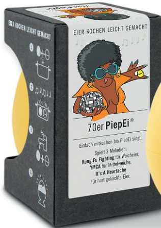
70er PiepEi www.brainstream.de

Die siebziger Jahre waren kulturell geprägt vom Discofieber, das aus den USA nach Deutschland schwappte und extrem schrille modische Kreise nach sich zog. Den politischen und wirtschaftlichen Veränderungen jenes Jahrzehnts trotzte man mit leuchtenden Farben, extravaganten Mustern sowie einem neuen Lifestyle. Ein bisschen davon ist zurück. Yeah!