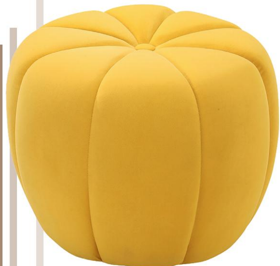
Sitzkissen „17 stories“ www.wayfair.co.uk