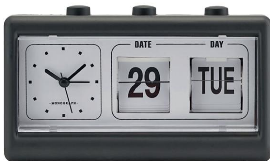
Retro Wecker www.coffeeandcloth.co.uk